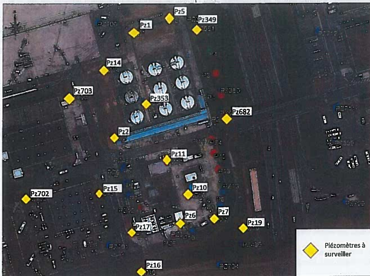
Figure 1 : Emplacements des piézomètres à surveiller.

C) Cette surveillance porte au minimum sur les paramètres suivants :